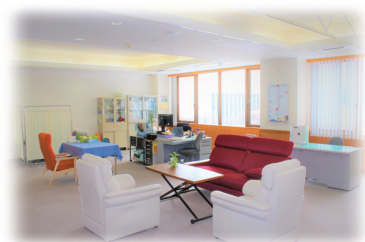
保健管理センター